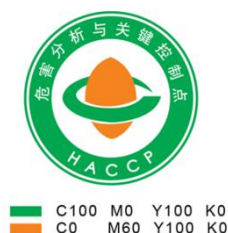
HACCP 管理体系认证标志

7.2.8.1 获证组织不得在产品、产品标签及产品内、外包装上使用 HACCP 认证标志。